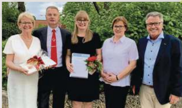
Familie StürerSinn: Drei Generationen ziehen an einem Strang.